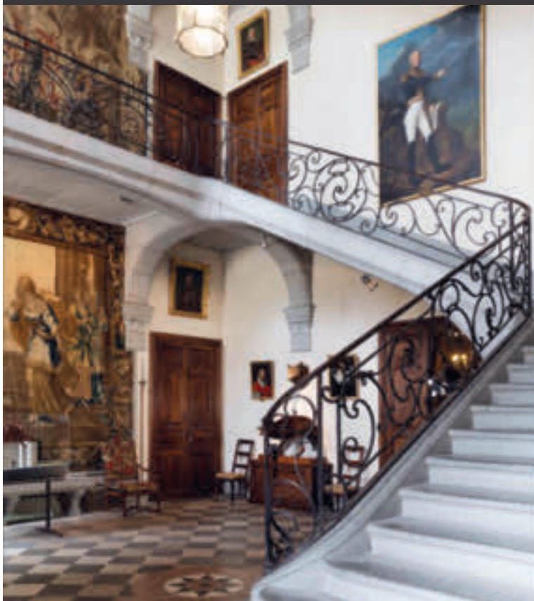
Le grand escalier d'honneur