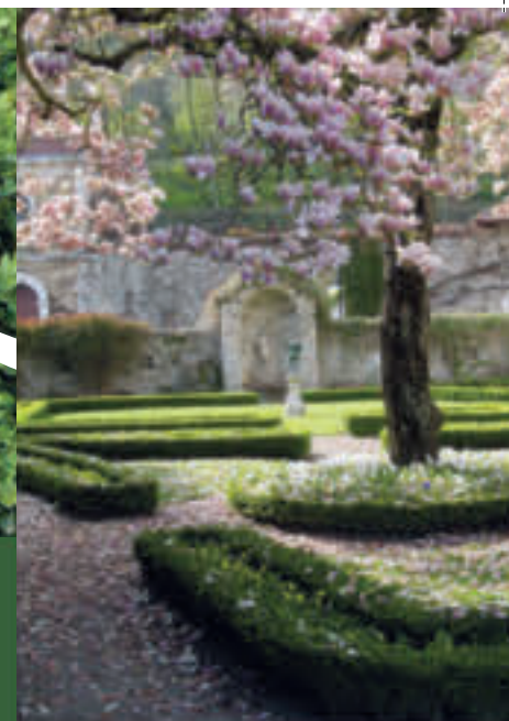
Jardin de la Comtesse