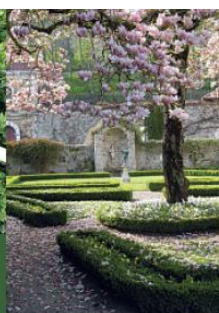
Jardin de la Comtesse