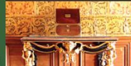
Salle à manger aux cuirs dorés