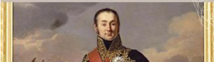
Portrait du Maréchal Oudinot

Edifié au Moyen-Age, le château est richement aménagé au 18 e siècle. Il a conservé ses décors et son mobilier et présente dans le parcours de visite, des souvenirs historiques de la Monarchie à l'Empire.