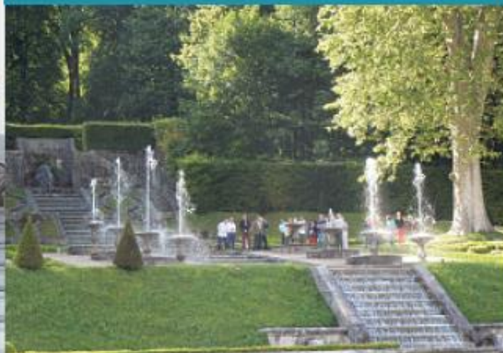
Élévation des eaux dans les jardins

Le château est entouré de magnifiques jardins en terrasse, couronnés d'un exceptionnel escalier d'eau à l'italienne alimenté par les eaux vives de la montagne.