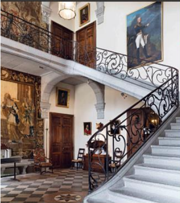
Le grand escalier d'honneur